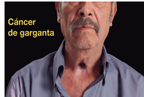
Cáncer de garganta