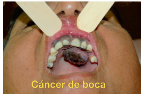
Cáncer de boca