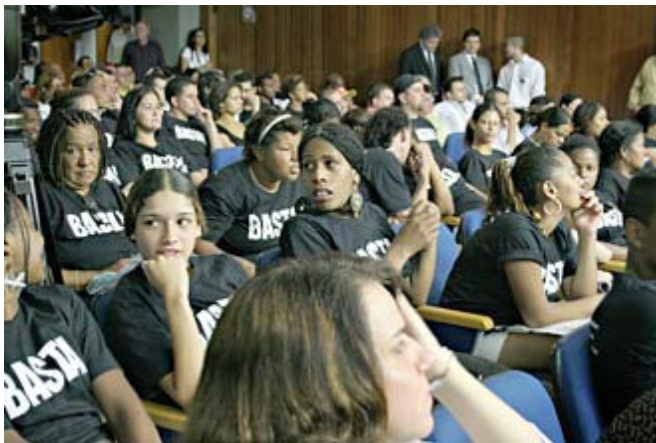
Manifestantes organizados por la industria en San Pablo. Con camisetas que dicen ‘Basta’ 37