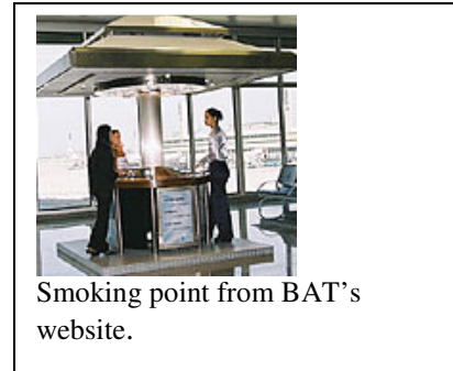
Smoking point from BAT's website.

En 2007, JTI “creó más de 200 salones con vidrio en el exterior para fumadores – con camareros, baños y ceniceros” 64 --y, para fines del 2008, la empresa planificó introducir áreas ventiladas para fumadores “en 15 aeropuertos internacionales con 46 salones, 70 cabinas para fumar y más de 60 estaciones para fumar.” 65 JTI promocionó las salas para fumar en el Aeropuerto Internacional de Narita (2006), 66 en el aeropuerto Shin-Chitose, en la provincia Hokkaido de Japón (2003) 67 y en Haneda, el aeropuerto más concurrido de Japón (2007). 68 En Japón, Philip Morris también se comunicó directamente con un fabricante japonés de ventilaciones para que aparentemente evalúe los sistemas de ventilación. 69