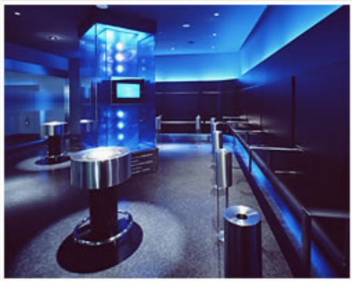
Punto para fumar en Haneda, el aeropuerto más concurrido de Japón (2007) 70

En 2007, JTI “creó más de 200 salones con vidrio en el exterior para fumadores – con camareros, baños y ceniceros” 64 --y, para fines del 2008, la empresa planificó introducir áreas ventiladas para fumadores “en 15 aeropuertos internacionales con 46 salones, 70 cabinas para fumar y más de 60 estaciones para fumar.” 65 JTI promocionó las salas para fumar en el Aeropuerto Internacional de Narita (2006), 66 en el aeropuerto Shin-Chitose, en la provincia Hokkaido de Japón (2003) 67 y en Haneda, el aeropuerto más concurrido de Japón (2007). 68 En Japón, Philip Morris también se comunicó directamente con un fabricante japonés de ventilaciones para que aparentemente evalúe los sistemas de ventilación. 69