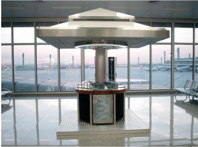
“Punto para fumar” que promociona BAT en Brasil, 2004. 63

Las tecnologías mecánicas de cambio de aire que promocionan la industria tabacalera y sus aliados incluyen sistemas de ventilación de ambientes, “puntos para fumar” (con una barra ventilada para fumadores en lo que debería ser un área libre de humo) y mesas para fumar.